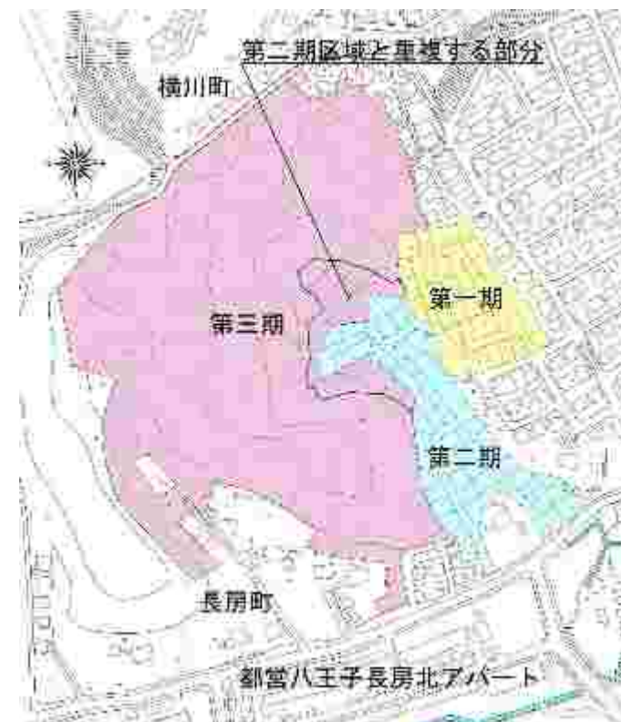
図1-1 造成期ごとの位置区分

今回造成する事で急傾斜地の高低差を雛壇形状に下げていき、事業地全体の勾配を緩くする事で、土砂災害特別警戒区域・土砂災害警戒区域の解除となる。その為にも今回の造成が必要と考えている。