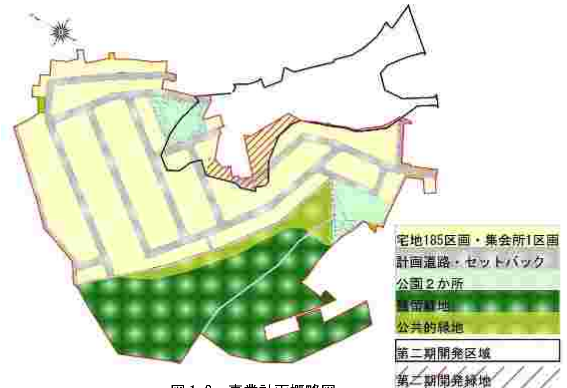
図1-2 事業計画概略図

第二期開発で設けた緑地に植栽した樹木は、現存する樹林と同種の樹木である為、残留緑地（回復緑地）に移植し整った環境での生育を図っている。