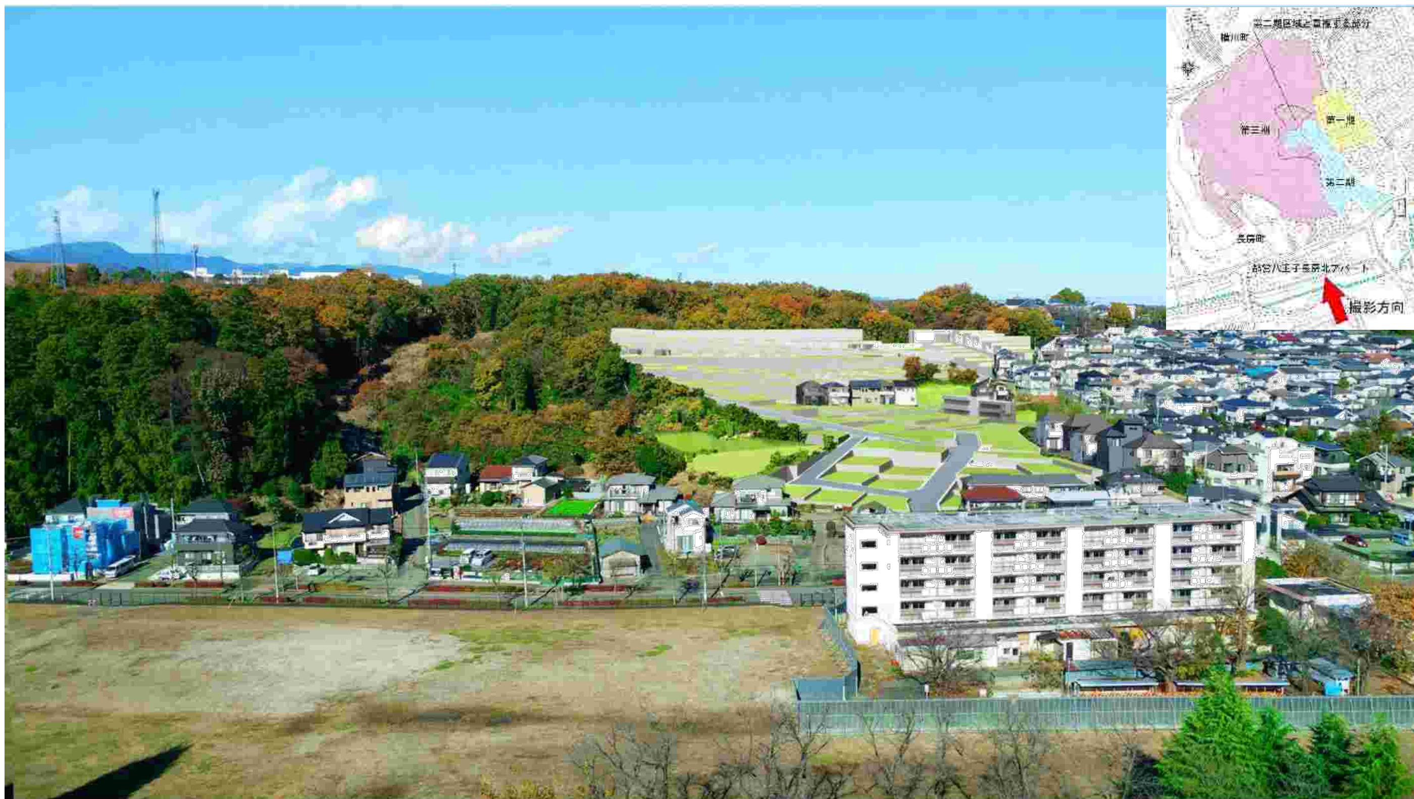
図 1-10 フォトモンタージュ