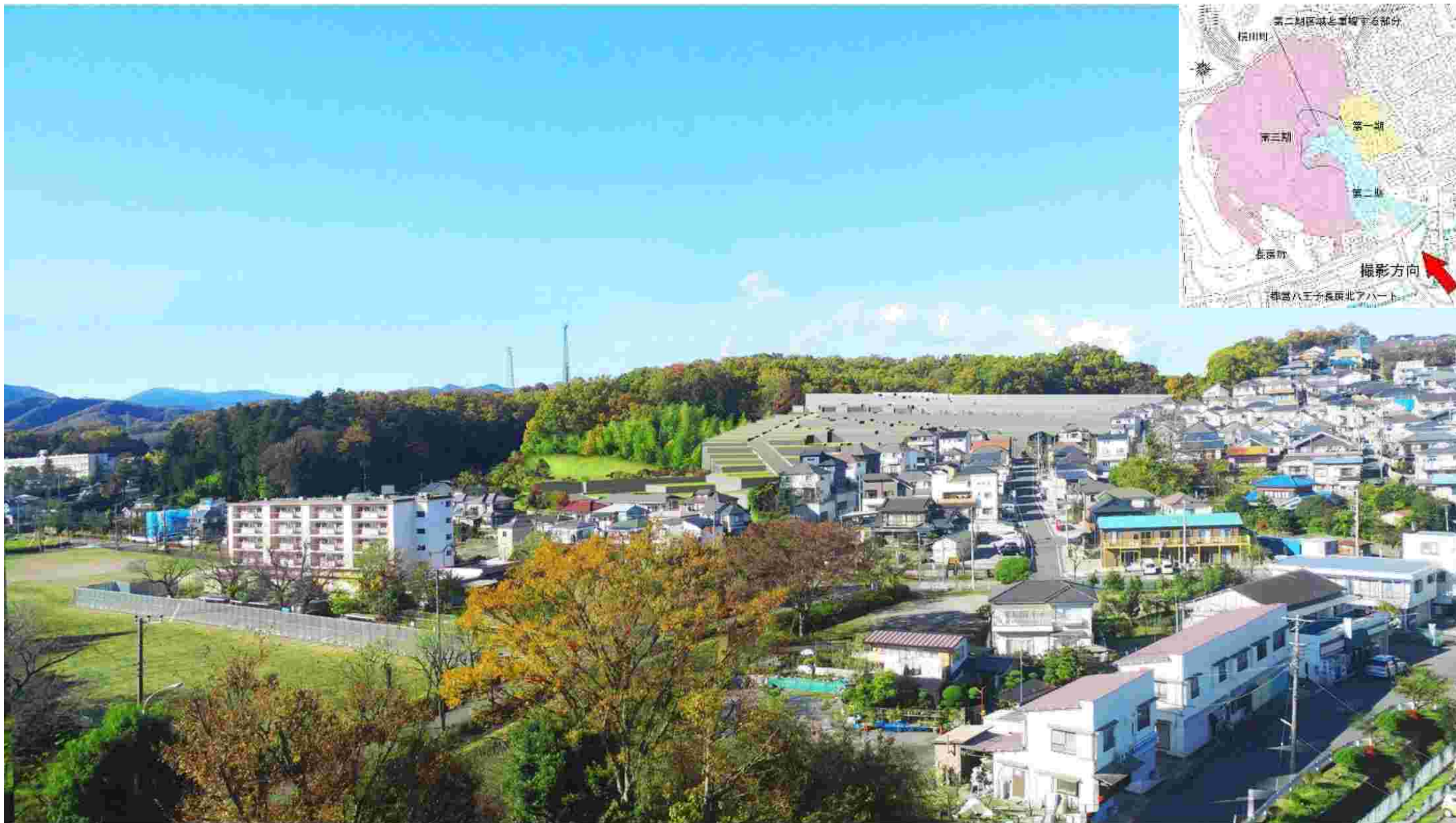
図 1-9 フォトモンタージュ