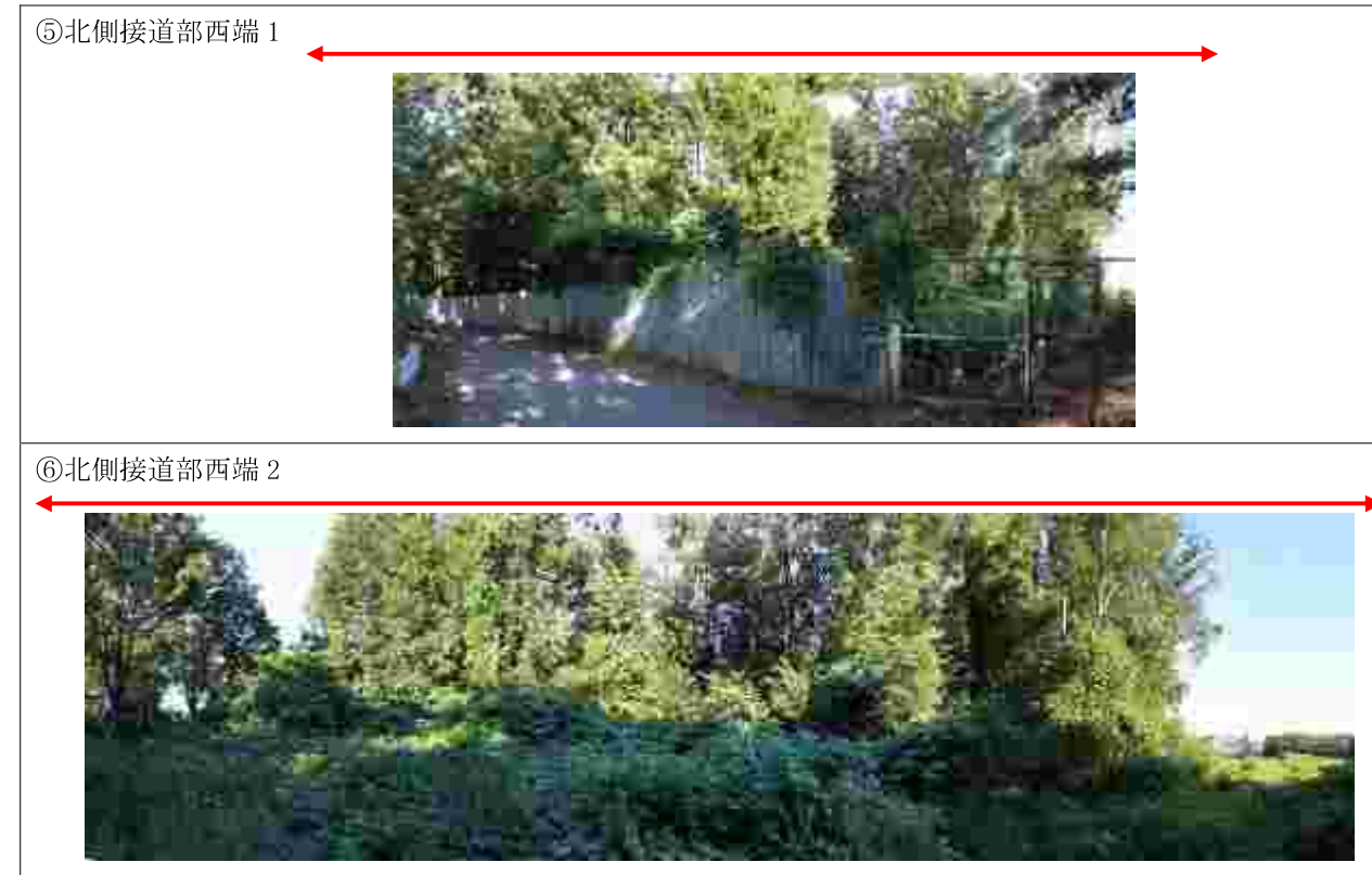
図 1-6 現況カラー写真 (2/2)