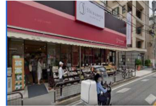
株式会社信濃屋食品 「弁当商品廃棄ロスの削減」