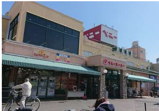
日東燃料工業株式会社 （ベニースーパー） 「総菜部門食品ロスの削減」