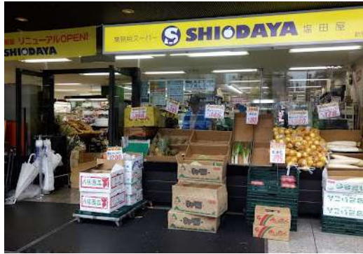
株式会社塩田屋 「牛タンの廃棄ロスの削減」