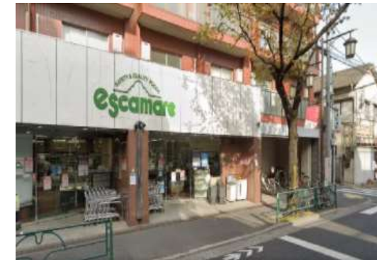
株式会社アデガワ （エスカマーレ） 「日配品におけるロスの削減」