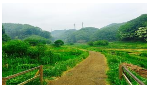
横沢入里山保全地域