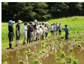
田植え作業の指導