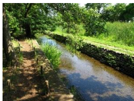
矢川緑地保全地域