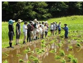
田植え作業の指導