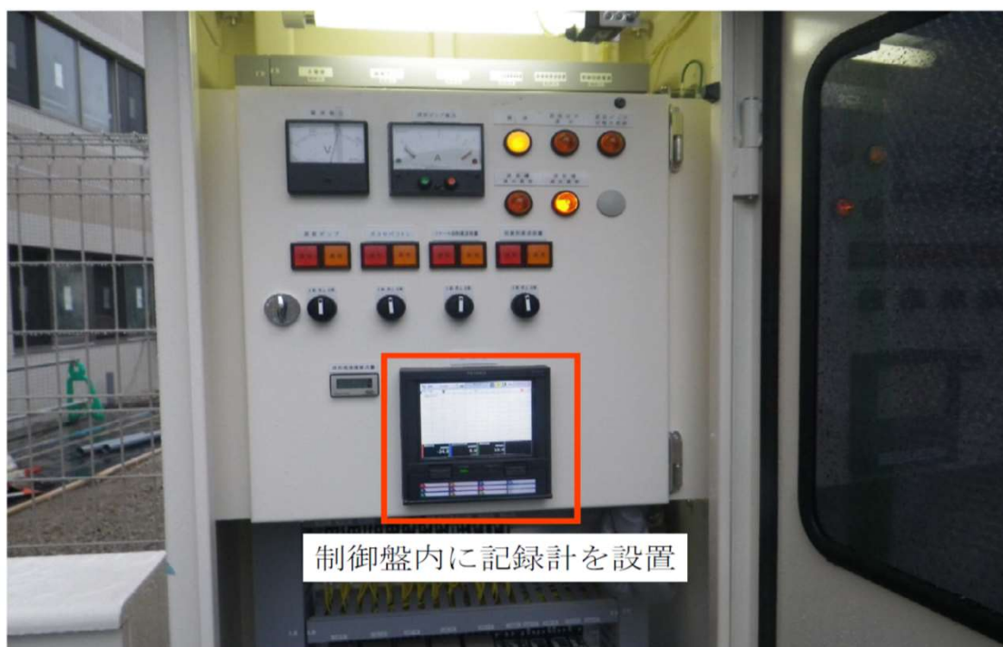
制御盤内に記録計を設置