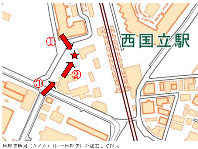
図3 詳細図（撮影方向）