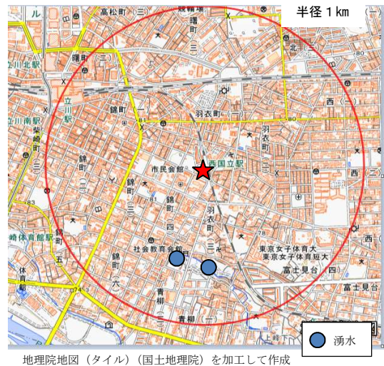
図2 周囲1 km 付近の様子