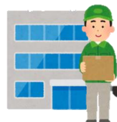
協力パートナー様