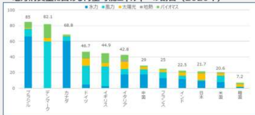
・電力消費量に占める再生可能エネルギーの割合（2020年）

(資料) IEA「Monthly Electricity Statistics-Data up to December 2020 (2021年3月) (6月24日ダウンロード)」を基に作成