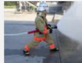
【霧状による放水イメージ】

さらに、鎮火後、必要に応じて太陽光発電設備を消防活動用の遮光シートで覆うことで、再出火防止を図っています。