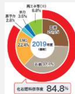
<日本の化石燃料の海外依存度>

(資料) IEA「Monthly Electricity Statistics-Data up to December 2020 (2021年3月) (6月24日ダウンロード)」を基に作成