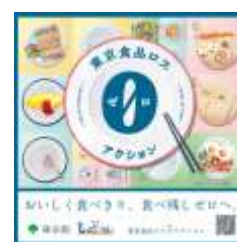
東京食品ロスゼロアクション啓発シール

食品ロス削減推進月間である10月を中心に、食堂や売店等を利用する職員等が率先して食品ロス削減につながる行動を実践するよう啓発を実施します。