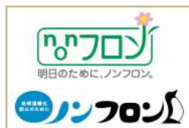
ノンフロンマーク

ノンフロン製品の開発状況等に応じて「東京都グリーン購入ガイド」や「東京都環境物品調達方針（公共工事）」における環境配慮仕様を改定し、都の事務事業に係る物品調達や公共工事におけるノンフロン機器等の導入を推進します。