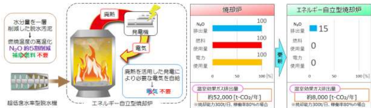
エネルギー自立型焼却炉の概念図