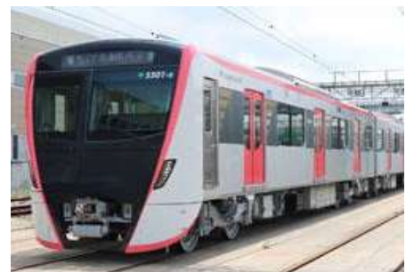
浅草線 5500 形 新型車両