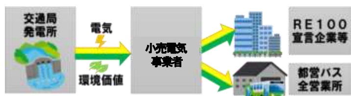
交通局の水力発電の電気供給イメージ