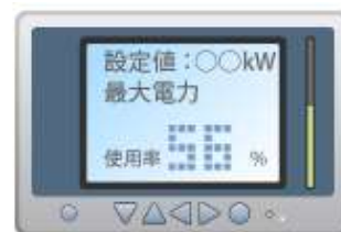
デマンド監視装置による「見える化」

また、デマンド監視装置等により消費電力を把握し、エネルギー使用状況を「見える化」することで、職員の省エネ行動につなげる取組も継続します。