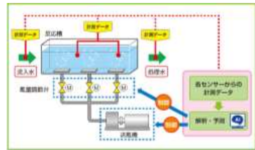
AI を活用した送風量制御技術のイメージ