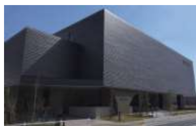
ZEB化の実証建築（東京都公文書館）

都有施設のエネルギー消費量を一層削減するため、新築・改築や大規模改修時に適用する「省エネ・再エネ東京仕様」を、最新の技術動向等を踏まえ適宜改正します。建築物の形状・配置の工夫、外壁・屋根の高断熱化などによる建築物の熱負荷の低減、LED照明、高効率空調機器等の導入による設備システムの省エネルギー化によって、一次エネルギー消費量を建築物の用途、特性等を踏まえ、原則として30%~50%（ZEB Readyや規模・用途によってはZEB Orientedとなる水準相当）以上削減することを目指した上で、太陽光発電をはじめとする再生可能エネルギーの利用を推進し、ゼロエミッション化を目指した建築物の実現に取り組みます。