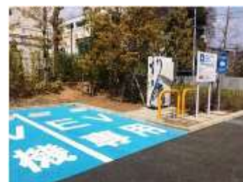
多摩環境事務所公共用充電器

公共用充電器の整備促進に向け、各局が所管する一般の都民利用がある施設のうち、駐車台数 10 台以上を有する都有施設について設置を検討し、駐車台数 50 台程度以上の都有施設については、積極的に設置を促進します。