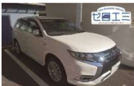
プラグインハイブリッド車 (2019 年度導入)