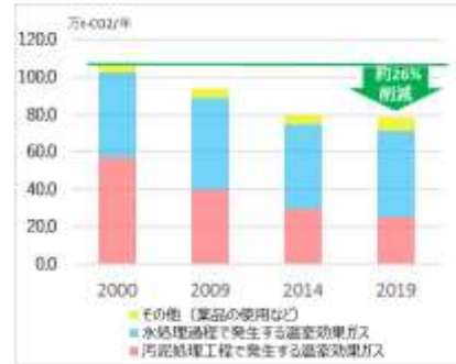
温室効果ガス排出量

下水道事業は、快適な生活環境と都市の水循環を支え、市街地を浸水から守る役割も担っていますが、その過程で大量のエネルギーを必要とし、多くの温室効果ガスを排出しています。また、処理水質の向上や浸水対策の強化などの下水道機能向上の取組により、エネルギー使用量や温室効果ガス排出量が増加する見込みです。そのため、下水道事業における地球温暖化防止計画「アースプラン」を策定し、最新の計画では温室効果ガス排出量を 2030 年度までに 2000 年度比で 30%以上削減する目標を設定しています。これまで、省エネルギーの徹底や再生可能エネルギーの利用拡大を進め、2019 年度には 2000 年度比で約 26%（約 28 万 t-CO 2 ）の温室効果ガス排出量を削減しました。今後、アースプランの取組に加え、温室効果ガス排出量のより一層の削減に取り組みます。