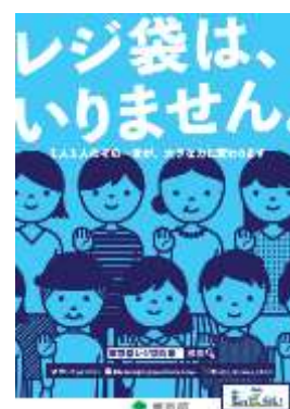
普及啓発ポスター

また、発生した廃プラスチックは、分かりやすい分別方法の周知・普及啓発等で分別の徹底を図り、再生利用に取り組みます。ペットボトルは、再生ペットボトルへのリサイクルが可能な施設への処理委託を推進します。