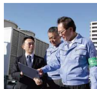
省エネ診断の実施 ＜（公財）東京都環境公社＞

さらに、省エネ講習会の開催を通じて、省エネ手法、省エネ診断の事例などをフィードバックしていきます。