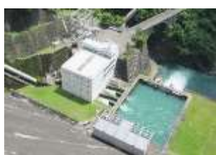
多摩川第一発電所

電気事業においては、多摩川上流にある 3 つの水力発電所により、CO 2 を排出しない再生可能エネルギーを小売電気事業者に売電しています。発電電力量は、一般家庭に換算すると年間約 3 万 5 千世帯分に相当します。2021 年度からは、公募により選定した小売電気事業者を通じて、都内の RE100 宣言企業や都営バス全営業所にも供給します。こうした新たな取組を通じて、ゼロエミッション東京の実現に向けて貢献していきます。