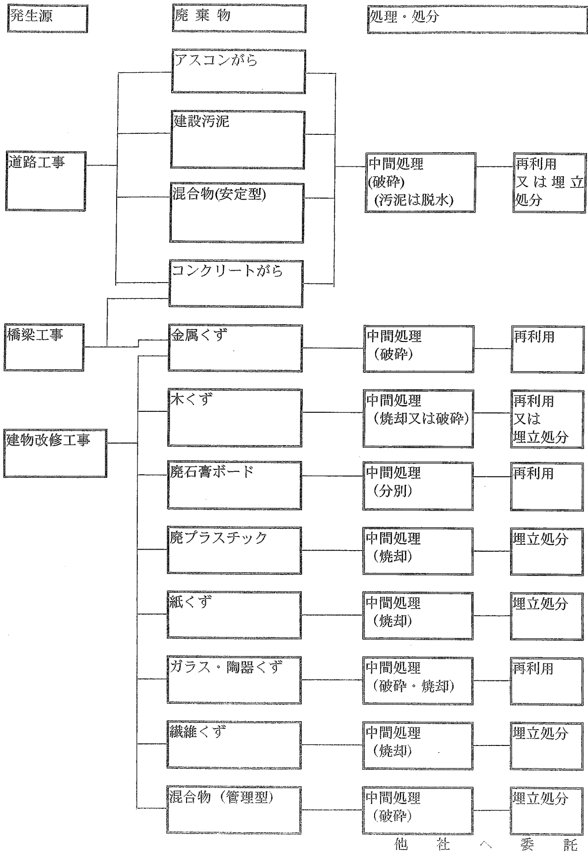
産業廃棄物発生フロー図