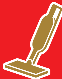
ハンディクリーナー