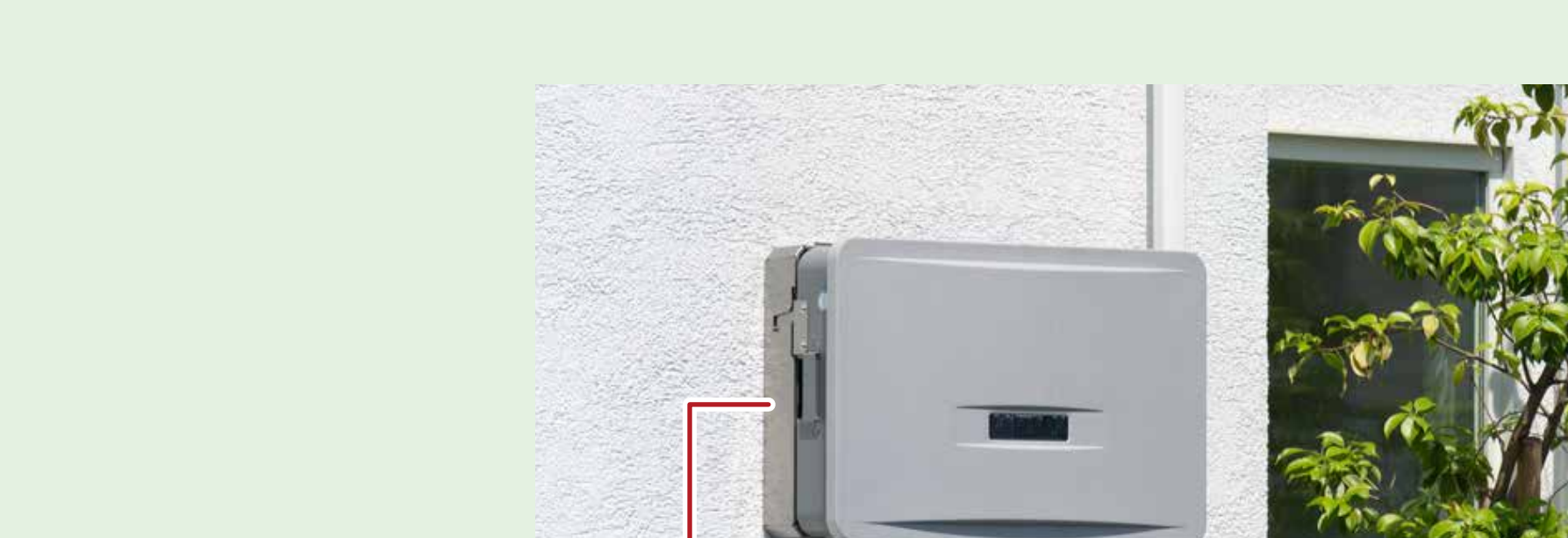
「パワーコンディショナー」とは、太陽光パネルで発電した直流電力を、家庭で使える交流電力に変換するための装置です

部分的な問題だったため、スムーズな修理で解決し費用は3万円ほど。13年間暮らして、目立ったトラブルはこの一度きりですね。