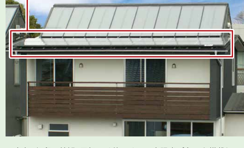
写真左 / S部の外観。屋根には約2.1kWの太陽光パネルを搭載しています

無理なく快適に暮らしつつ、電気の使用方を工夫することで、楽しみながらエコな暮らしを満喫できています。