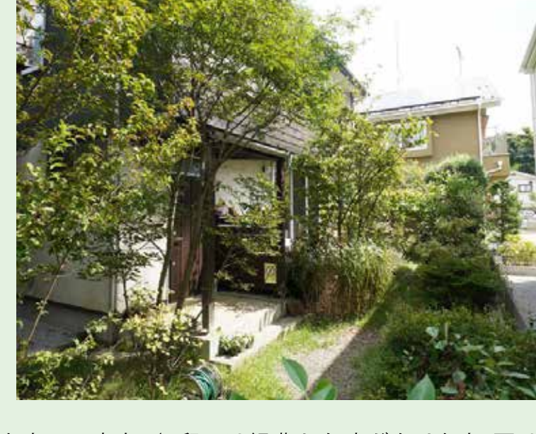
写真右 / S部には緑豊かな庭があります。夏は庭の樹々が生き茂り、暑い日差しを和らげてくれます