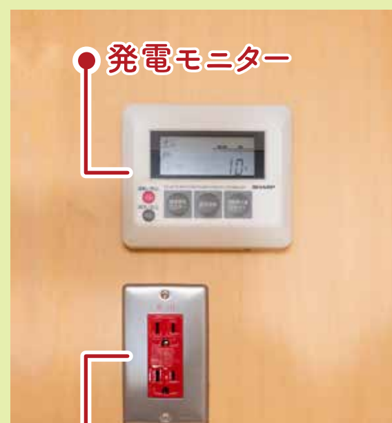
写真左 / ポータブル蓄電池を説明してくださったSさん。サイズもちょうどよく、機能的なそうです。写真右 / 太陽光パネルの発電量をリアルタイムで表示するモニターと、太陽光パネルと繋がり、停電時でも電力を供給できる非常用コンセント