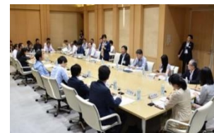
東京都食品ロス削減パートナーシップ会議