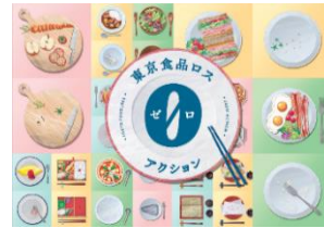
東京食品ロスゼロアクション (啓発冊子)