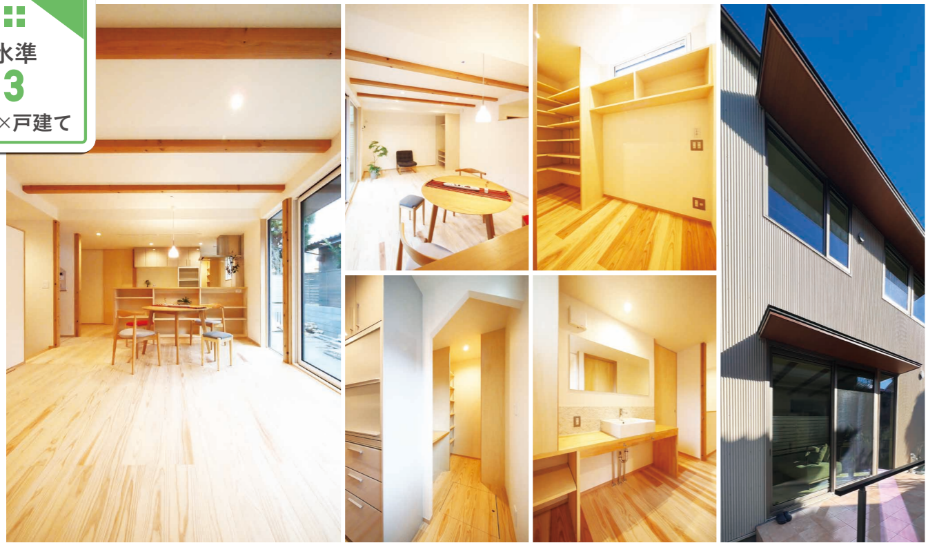
間取りでは家族(夫婦と子ども2人)それぞれの居場所づくりを重視。2階には書斎と2つの子ども部屋を設け、奥様のために1階キッチン奥のパントリーにはカウンターをつくりました。敷地は比較的余裕がありますが、住宅街で隣の家も近いので、600mmの軒の出で視線を遮ります