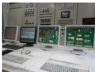
エネルギー監視システム