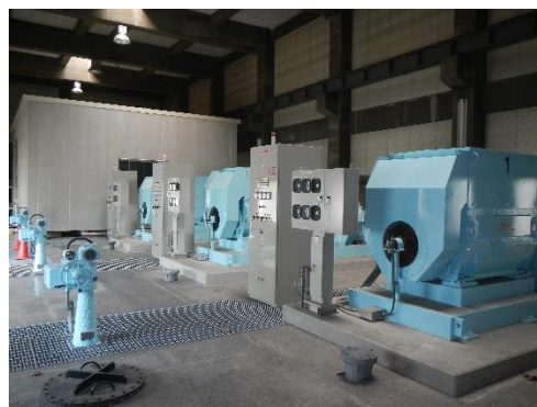
図1. 高効率上水道ポンプ