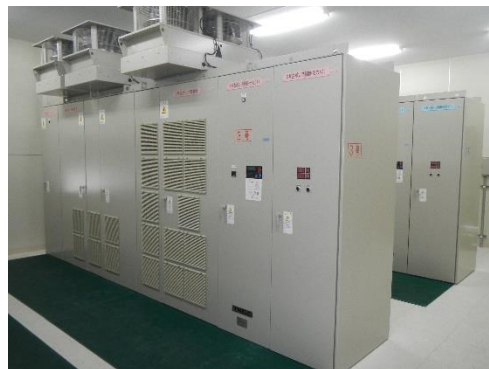
図2. インバータ制御装置