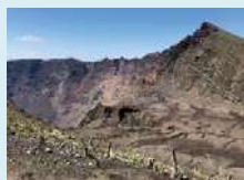
<雄山火口付近の様子>